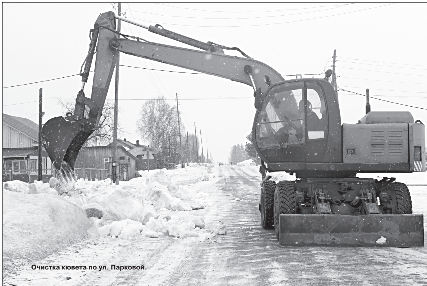
Очистка кювета по ул. Парковой.