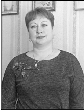
В Тегульдетском районе хранителями и популяризаторами культурного на-

25 марта люди творческих профессий, которые вносят неоценимый вклад в духовное развитие общества, отметят День работника культуры России.