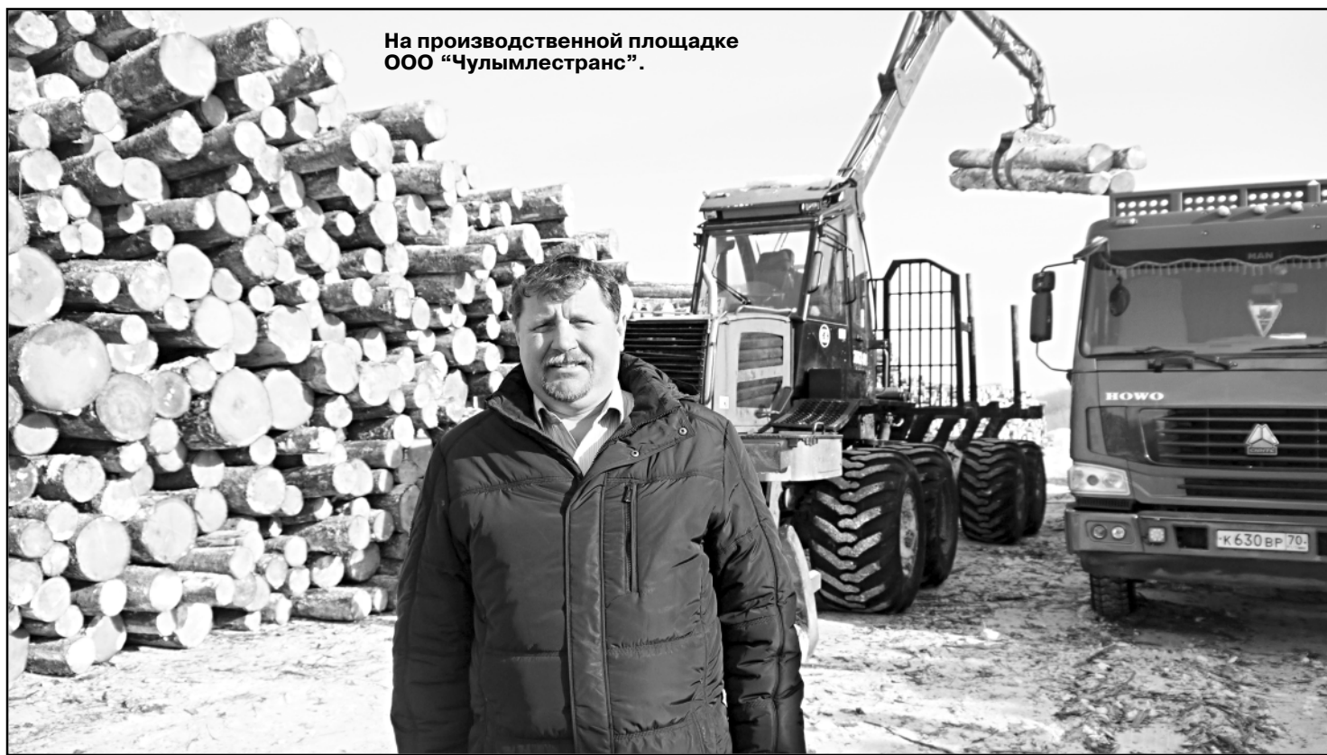
На производственной площадке ООО «Чулымлестранс».