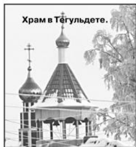
Храм в Тегульдете.

История православия в Тегульдском районе сохранила совсем немного достоверных исторических фактов, но тем интереснее и ценнее каждая новая "восточка" из прошлого.