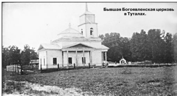
Бывшая Богоявленская церковь в Туталах.

Священник Чердатской Богородиче-Казанской церкви в своем прошении 28 июля 1879 г. пишет: "В инородческом селе Тутальском Богоявленской церкви с декабря 1877 года нет местного священника. Заведывающий оным приходом священник села Чердатского весьма тяготеет возложенными на него обязанностями, так как приход Тутальский отстоит от последнего более чем на 200 верст и притом пути к сообщению на длительное время преграждается рекой Чулымом, по которой и совершается езда в лодке на протяжении всего прихода. Священник, приглашенный к больному, не застает