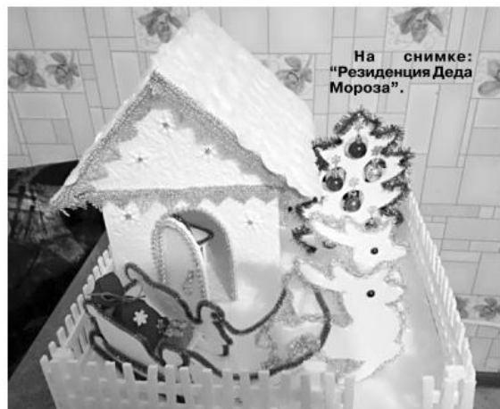
На снимке: «Резиденция Деда Мороза».

Сейчас для новогоднего оформления своего жилища можно купить всё необходимое в магазине: красочные гирлянды, фонарики, наклейки и множество других разноцветных и сверкающих украшений.