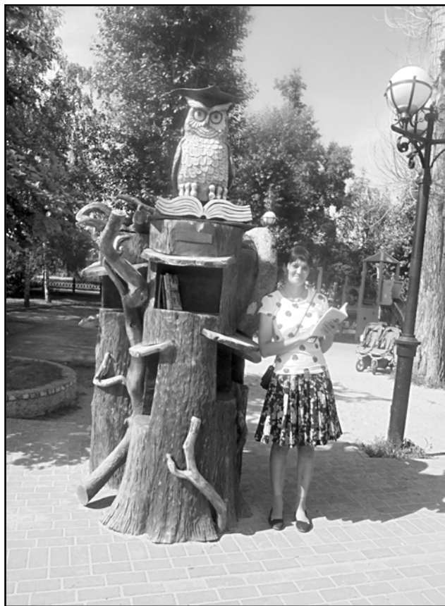
На фото: Людмила Ландышева