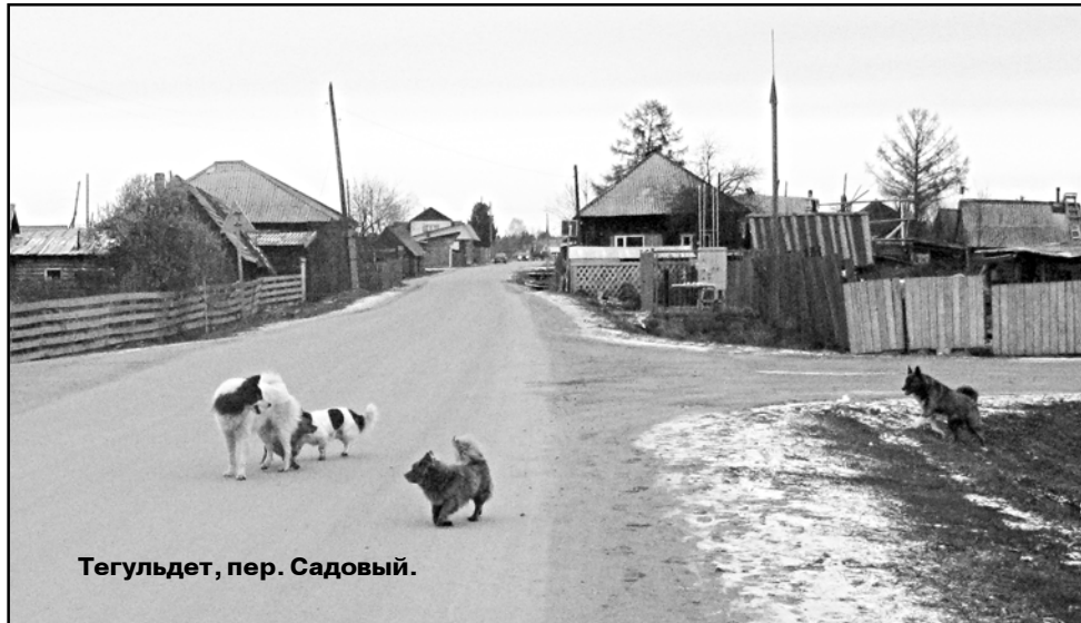
Тегульдет, пер. Садовый.

Я являюсь членом административной комис-