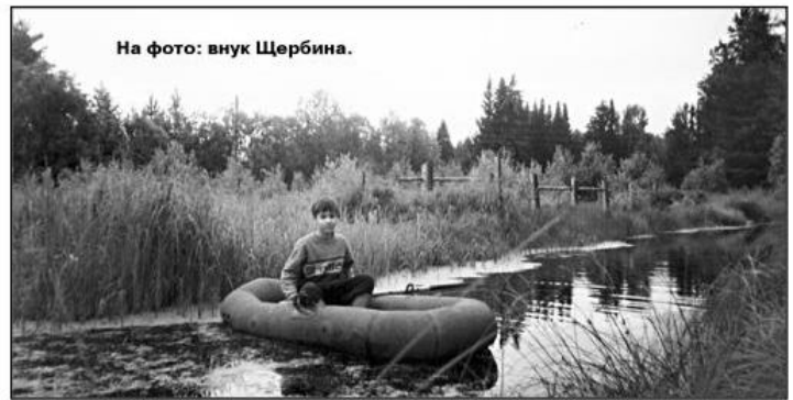
На фото: внук Щербина.