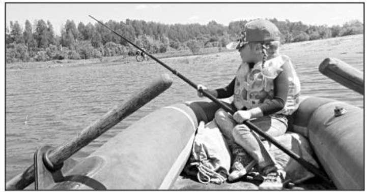
Самый лучший отдых - в деревне на рыбалке с дедом.