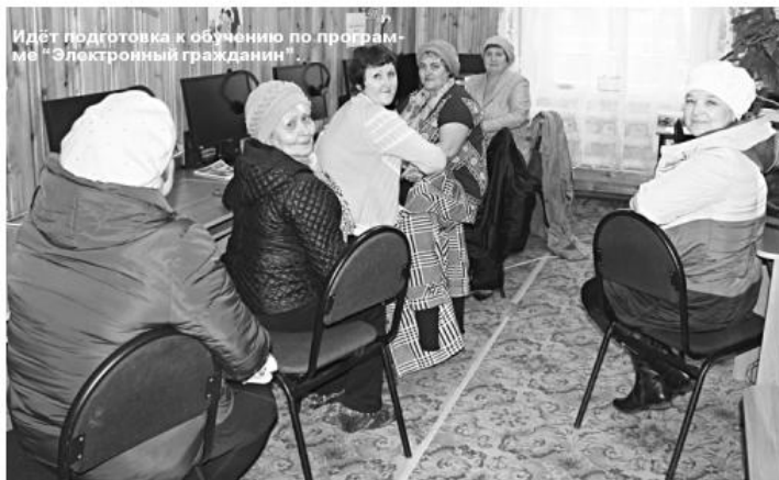
Идёт подготовка к обучению по программе «Электронный гражданин».

Это аппаратно-программный комплекс, оборудованный полностью укомплектованными автоматическими рабочими местами. Они объединены в локальную сеть и подключены к информационно – телекоммуникационной сети «Интернет». В каждом ЦОДе имеется многофункциональное устройство, позволяющее распечатывать, копировать, сканировать и отправлять по электронной почте документы. В Тегульдете ЦОД стал работать в феврале 2014 года. На данный момент его посетило 5452 человека, по линии полиции – 375.