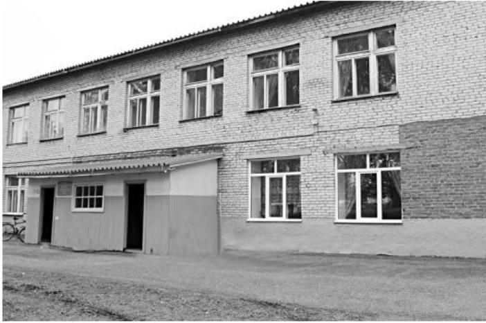
В этом году. Руководство района для этого прикладывает все силы.