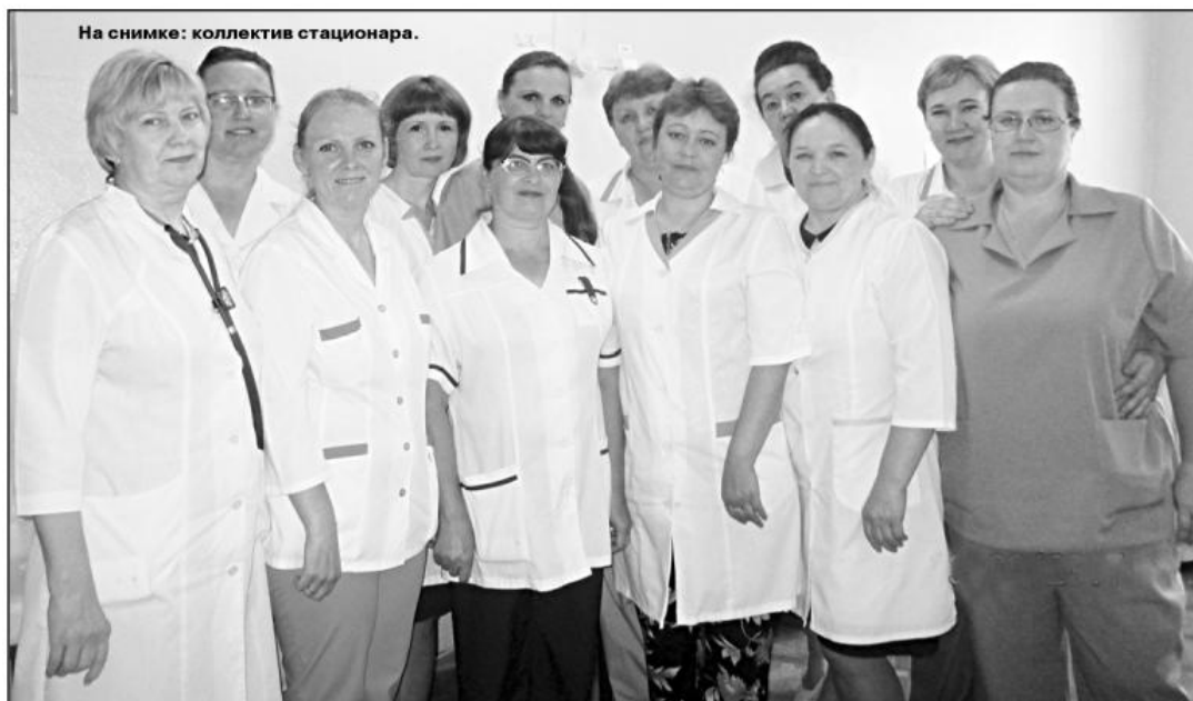
На снимке: коллектив стационара.

18 июня, в третье воскресенье первого месяца лета, отмечается День медицинского работника. Это праздник людей, обучившихся бесценному ремеслу – сохранению жизни и поддержанию здоровья пациентов. Врачи, медсестры, фельдшеры, фармацевты – настоящие герои нашего времени, от которых зачастую зависят судьбы людей.