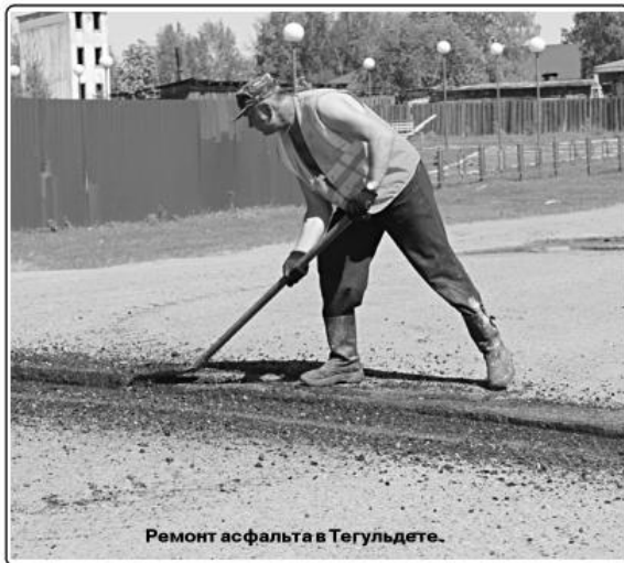
Ремонт асфальта в Тегульде.