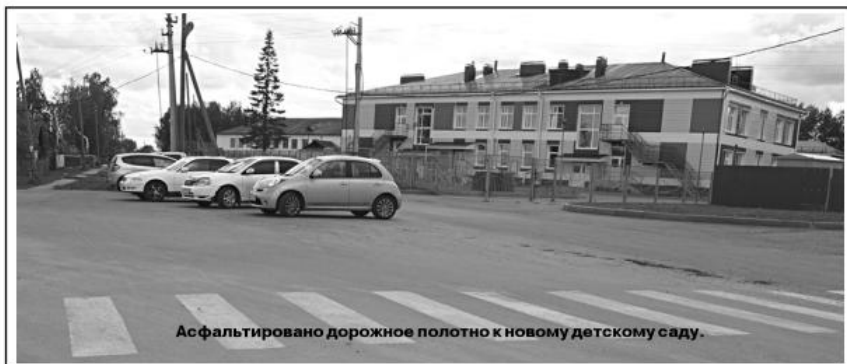
Асфальтировано дорожное полотно к новому детскому саду.