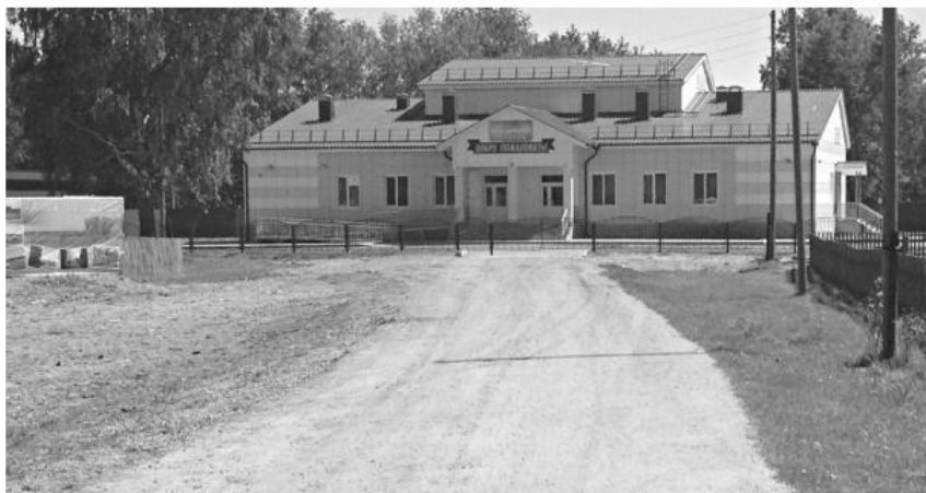
Дорога к новому Берегаевскому Дому культуры, открытому губернатором С.А. Жвачкиным.

кром щебнем, - продолжает Олег Алексеевич . - В 2017 году запланирован хоть и меньший по площади объем работ, но более дорогостоящий, так как он связан с укладкой труб и применением щебеночного покрытия».