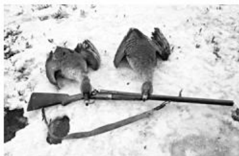
Весенняя охота на пернатую дичь в Томской области, согласно Поста-

новлению губернатора, откроется с 29 апреля и продлится до 8 мая . В Тегульдetskом районе охота разрешена в охотугодьях области, за исключением особо охраняемых природных территорий федерального зна-