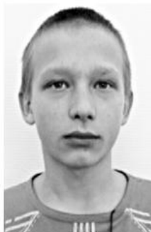
каб. 34, тел. 2-13-47.