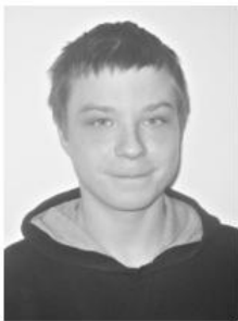
рису: с. Тегульдет, ул. Ленина, д. 97 (здание районной Администрации), каб. 34, тел. 2-13-47.

По возникающим вопросам обращаться по ад-