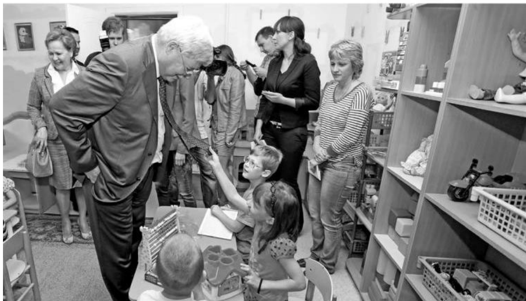
■ Теперь детских садов хватает всем самым маленьким жителям области