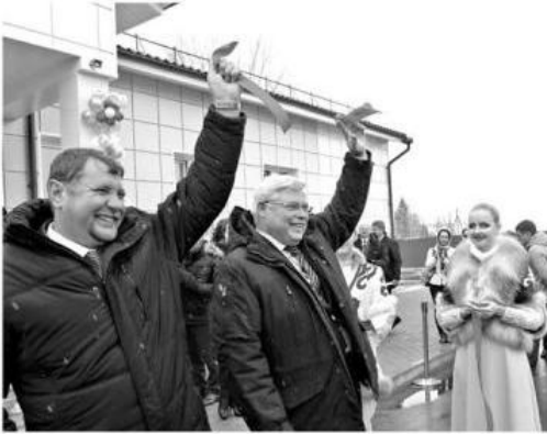
■ Губернатор открыл культурный центр в Берегаево