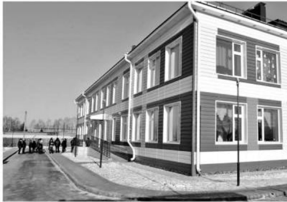
■ Подходы к соцобъектам — приоритет дорожной программы