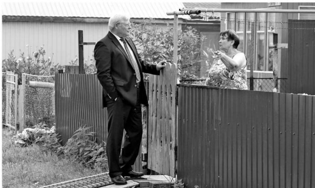
■ Программу ремонта дорог губернатор разработал вместе с жителями городов и сёл