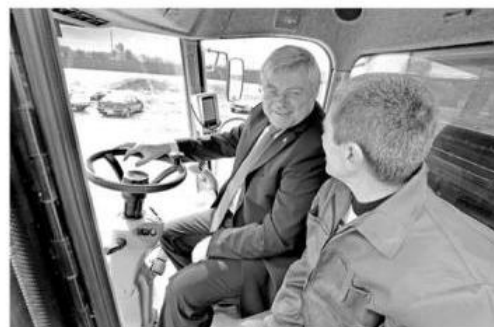
■ Губернатор Сергей Жвачкин пять лет у руля региона

миллиардные контракты с «Газпромом», а томский Волк Забивака стал талисманом чемпионата мира по футболу 2018 года. Мы составили «великолепные пятерки» главных событий года в экономике и социальной сфере.