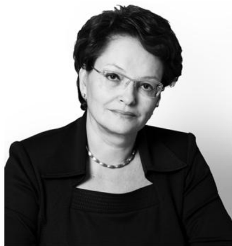
Оксана КОЗЛОВСКАЯ председатель Законодательной Думы Томской области

пойти направо или налево, можно вернуться назад, но самый правильный путь - это путь вперед.